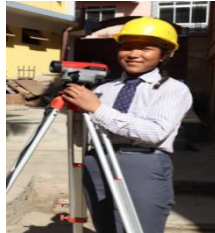
सिभिल इन्जिनियरिङ (building construction)